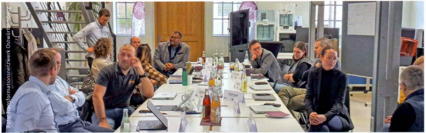
Der Workshop des Netzwerks Nachhaltigkeit war gut besucht.